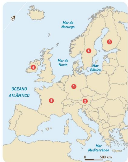
Figura 4 - Mapa político da Europa.