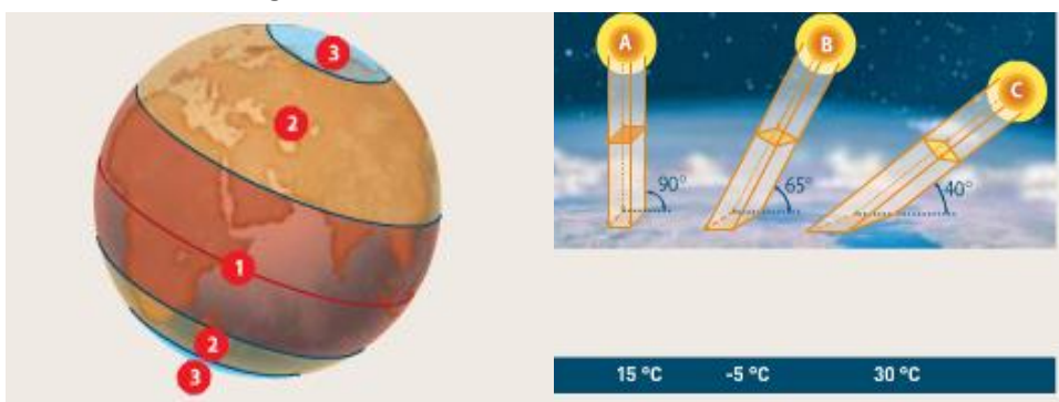
Figuras 5 e 6

12. Observa atentamente as figuras 5 e 6.